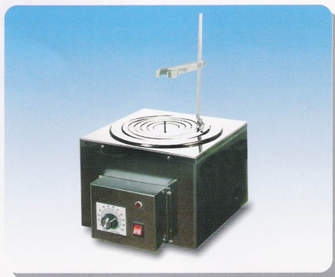
WB-24 • WB-30